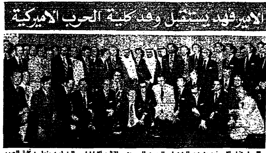
استقبل الجنرال عبد العزيز بن عبد العزيز السعود والجنرال الالبرنيس الزراء، وهذا من كلية الحرب الاميركية يزور المملكة حاليا، كما يبدو الصورة اعلاه

سحب لرحيل الدول الخليج العربية الاخرى الصول على صيغة دولة الامارات بعد التلبية مدة ثلاث سنوات في الاتحاد، بينما يحق للرحيل العرب الاخرين الحصول عليها بعد اربعة سبوع سنوات، وذلك بموجب مشروع جديد في ابو ظبي.